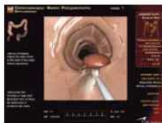
リアルにシミュレート