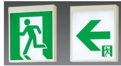
通路誘導灯・避難口誘導灯